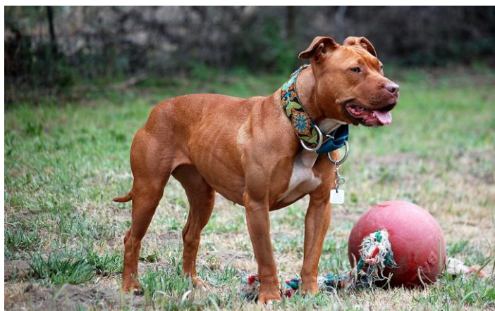
ภาพที่ 2.4 American Pit Bull Terrier