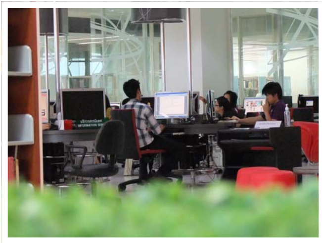
บริการ Internet Zone และ Wi-Fi อย่างทั่วถึง

“สำนักบรรณสารการพัฒนาเป็นห้องสมุดเพื่อ การวิจัยในสาขาพัฒนบริหารศาสตร์และพัฒนาไปสู่ การเป็นห้องสมุดดิจิทัลอย่างสมบูรณ์”