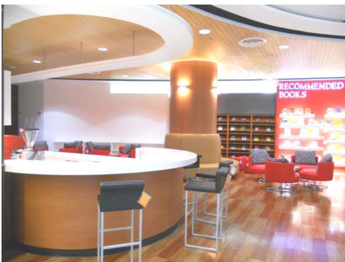
พักผ่อน ฟอนคลายอิริยาบถ จิบกาแฟเลิศรส ที่ Coffee Corner