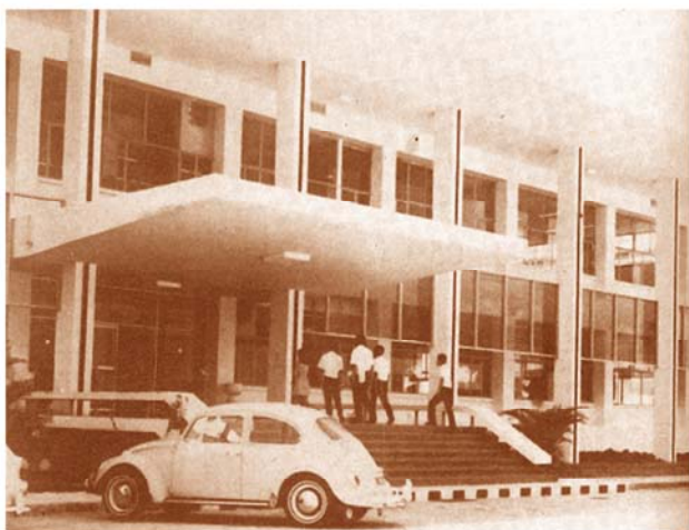
พ.ศ.2513 อาคารห้องสมุดเอกเทศ (บริเวณหอประชุมเฉลิมพระเกียรติฯ ในปัจจุบัน)