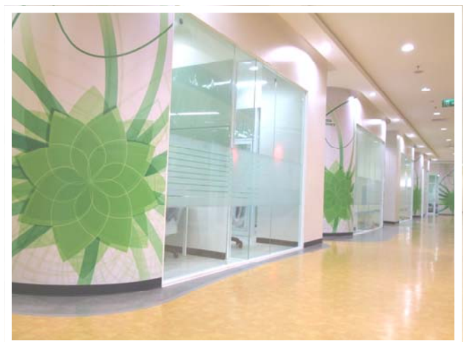
Study Rooms จำนวน 75 ห้อง