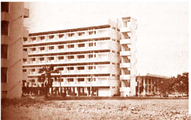
พ.ศ.2509 อาคาร 1

สำนักบรรณสารการพัฒนาก่อตั้งขึ้นพร้อมกับสถาบันบัณฑิตพัฒนบริหาร- ศาสตร์ในปี พ.ศ. 2509 ที่ทำการแห่งแรกของห้องสมุดอยู่ที่อาคาร 1 ของสถาบัน ต่อมาปี พ.ศ. 2513 ได้ย้ายมายังอาคารเอกเทศ (หอประชุมเฉลิมพระเกียรติ 6 รอบ พระชนมพรรษาในปัจจุบัน) และเดือนตุลาคม 2541 ย้ายที่ตั้งมาอยู่ ณ อาคาร อเนกประสงค์ ชั้น 2-4 (อาคารบุญชนะ ภัตตาคาร ในปัจจุบัน) และในปี พ.ศ. 2553 สำนักฯ ได้รับงบประมาณในการปรับกายภาพพื้นที่ทั้งหมดให้มีความสวยงาม สะดวกสบาย และมีความทันสมัย