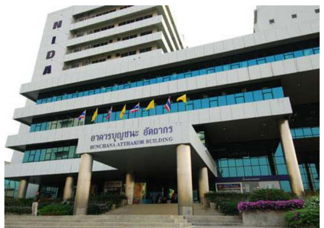
พ.ศ.2541-2553 อาคารบุญชนะ ภัตตาคาร ชั้น 2-4