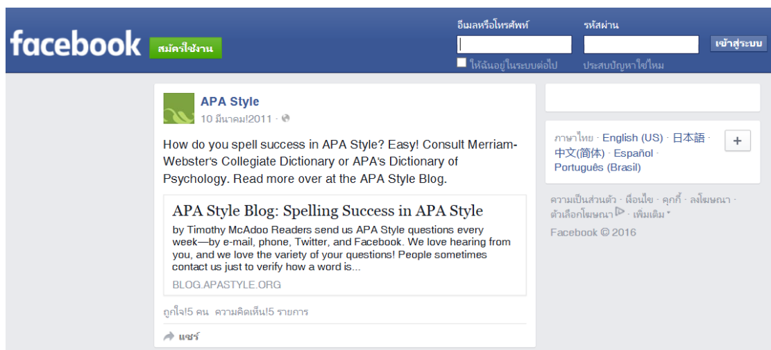
ภาพที่ 5.3 ตัวอย่างหน้า Facebook Status Update เป็นกลุ่ม