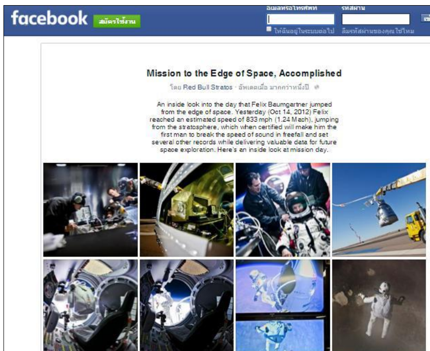
ภาพที่ 5.5 ตัวอย่างหน้าอัลบั้มรูปภาพ (Photo Album)

ตัวอย่าง Red Bull Stratos. (2012, October 15). Mission to the edge of space, accomplished [Photo album]. Retrieved from https://www.facebook.com/media/set/?set=a.507275739283434.122701.122924687718543 การอ้างอิง (Red Bull Stratos, 2012)