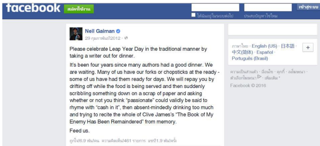
ภาพที่ 5.2 ตัวอย่างหน้า Facebook Status Update ส่วนบุคคล